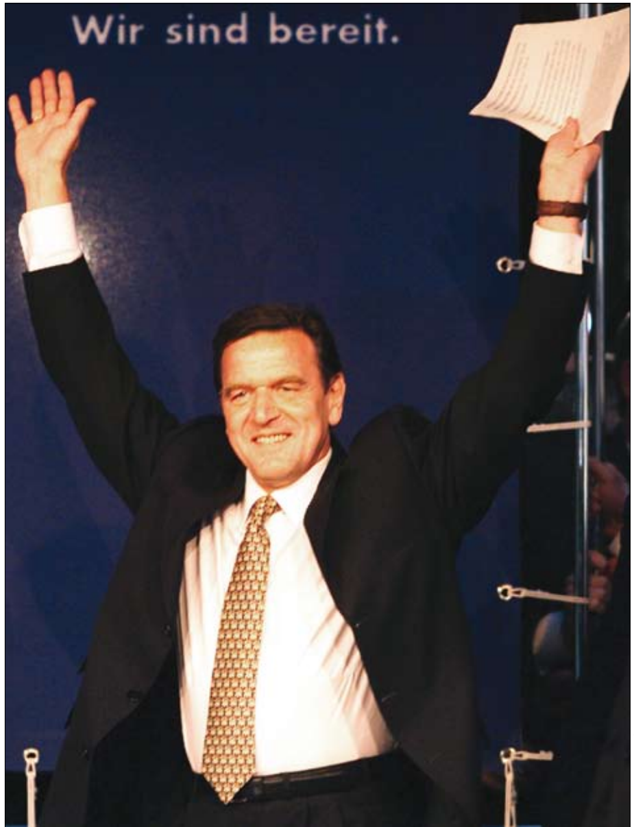
Hier ein triumphierender Bundeskanzler, der gerade – „denen haben wir es aber gezeigt“ – die Wahl gewonnen hat und die Sektkorken knallen läßt.

Jeder an der Abstimmung Beteiligte – Mitglied des Gemeinderates, des Länderparlaments oder des Deutschen Bundestags beispielsweise – ist an der Entscheidung der