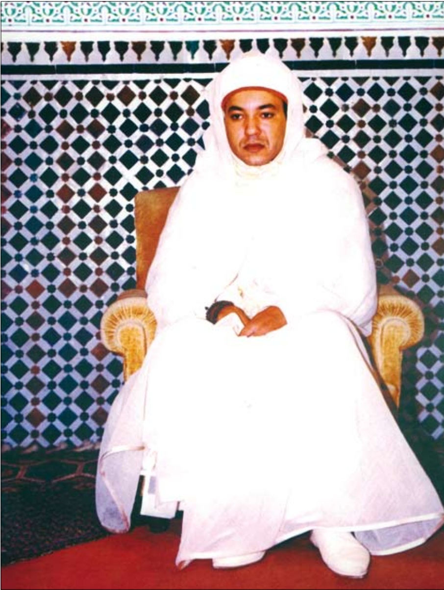
Hier der junge marrokanische König: bescheiden, gefaßt, ja demütig unter dem gewaltigen Eindruck der Übernahme eines heiligen Amtes.

mung keinerlei Verantwortung. – Ahnen wir hier, welche Abgründe sich da auftun? – Niemand trägt gemäß demokratischem Verfahren, „Abstimmung“ genannt, Verantwortung. Und dies gilt überraschenderweise sogar für den Fall, daß am Ende haargenau das als Ergebnis herauskommt, für das er gestimmt hatte. Auch in diesem Fall, man glaubt es kaum, ist er – man glaubt es kaum – nicht verantwortlich.