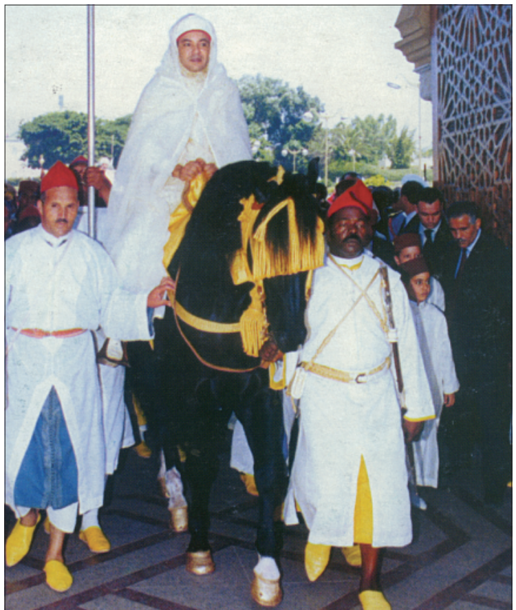
Daß wir den König – hier der junge König Marokkos, Muḥammad VI. bei den Feierlichkeiten seiner Inthronisation – nicht kontrollieren, sondern lieben, weil er der König ist, erscheint auf den ersten Blick ebenso überraschend wie der Umstand, daß das demokratische System einen blinden Fleck hat, weil auch mit einer Lupe dort nirgendwo jemand zu finden ist, der wirklich entscheidet und Verantwortung trägt. Sehr merkwürdig, daß in einer Abstimmung zwar jeder entscheiden kann, wem er die Stimme gibt, die zur Abstimmung stehende Sache selbst indes ganz unentschieden bleibt, wenn man’s nicht dem armen Abakus, dem Rechenschieber, in die Schuhe schieben will. Dazu siehe Seite 26 ff.